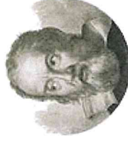
"Galileo Galilei" Liceo Scientifico

Sede associata Liceo Scientifico "G. Galilei" Spadafora (Messina)