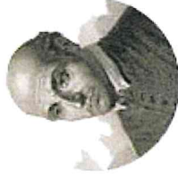
"Francesco Maurolico" Liceo Ginnasio